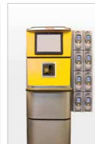
4. Betaalpaal voor self payment