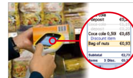
2. Handterminal met realtime promoties