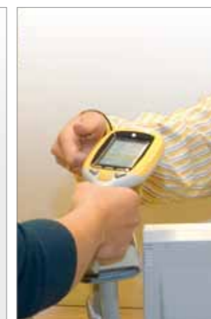
4. Normale checkout