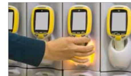
1. Klant neemt een handterminal aan de ingang van de winkel

Dit alles zorgt voor een snellere afhandeling van klanten en maakt het winkelen zelfs tijdens de piekuren leuk!